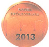
Medal DOBRA SPÓŁDZIELNIA 2013