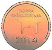
Medal DOBRA SPÓŁDZIELNIA 2014