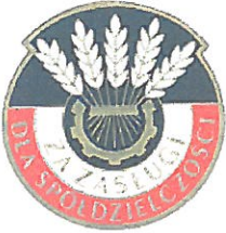
Medal ZA ZASŁUGI DLA SPÓŁDZIELCZOŚCI