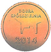
Medal DOBRA SPÓŁDZIELNIA 2014

„WEMA” WENTA Sp. j. ul. Chłopska 20 84-239 BOLSZEWO