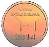
Medal DOBRA SPÓŁDZIELNIA 2014