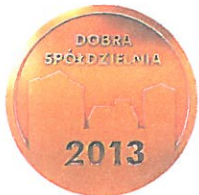
Medal DOBRA SPÓŁDZIELNIA 2013