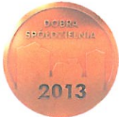
Medal DOBRA SPÓŁDZIELNIA 2013